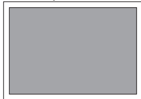
1/1 Seite quer